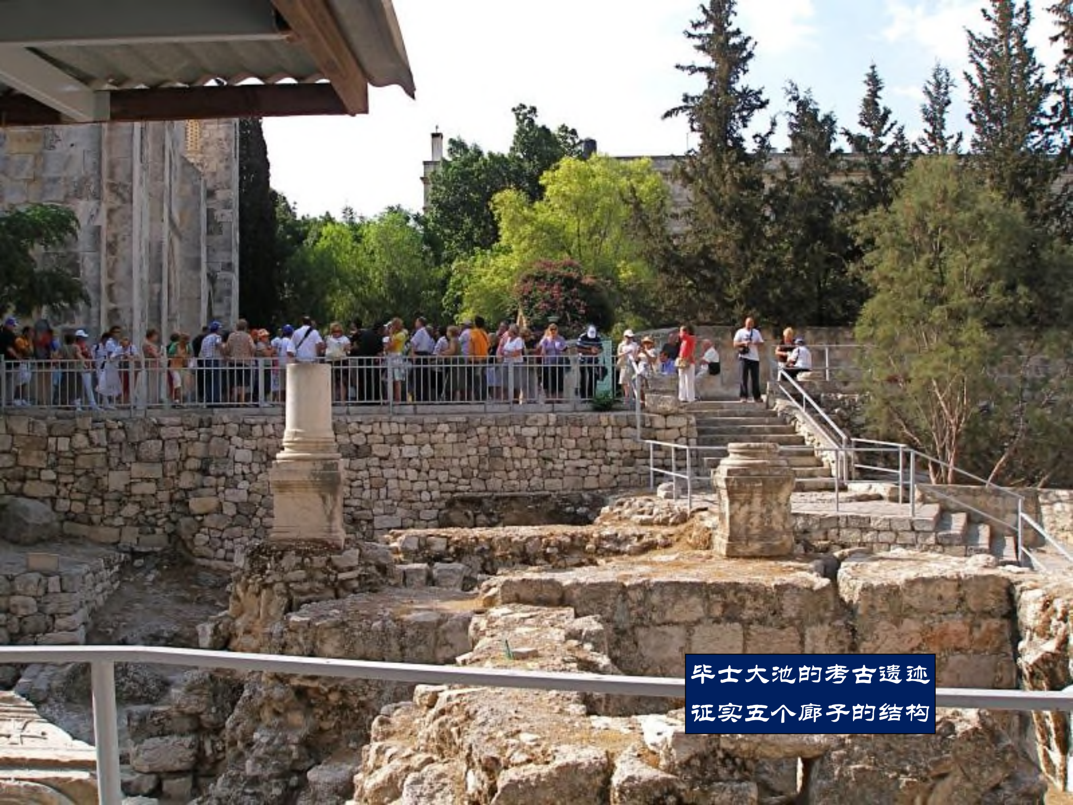
毕士大池的考古遗迹 证实五个廊子的结构